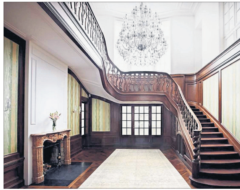
Großformat: Villa in Döbling mit Botschaftshistorie.

Denn den historischen Details wurde in allen Räumen großer Stellenwert eingeräumt: Diese reichen von Fischgrätparkettböden in Nussholz bis zu Textiltapeten und aufwendigen Stuckaturen an den Wänden. Die hohe Decken, Flügeltüren und glänzenden Holzvertäfelungen in der Empfangshalle tragen das Ihre zu der besonderen Atmosphäre dieser großen alten Dame bei. Die mit Informationen über den genauen Preis des Objekts genau so zurückhaltend ist wie andere große alte Damen mit