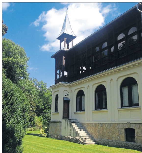
Für eine Hofdame Kaiser Franz Josefs wurde das Objekt links in Aigen errichtet. Theophil Hansen war der Architekt der Villa in Ternitz.