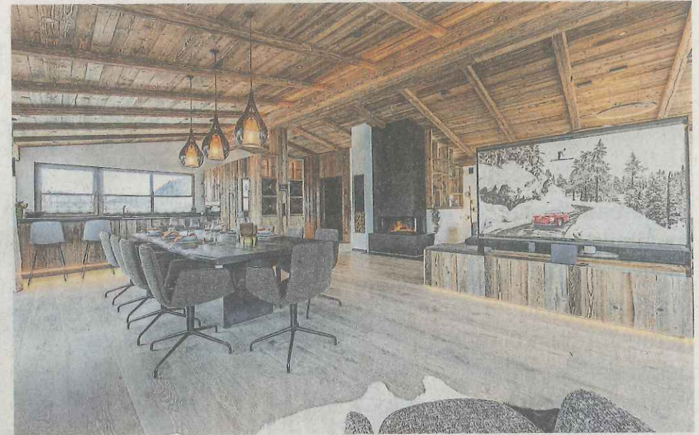
Das Neubau-Chalet in Going kostet komplett möbliert 6,8 Millionen Euro.

Jede Menge Altholz in Kombination mit modernem Design, viel Schwarz, Weiß und Grau gibt es in einem Neubau-Chalet in Going. Das verfügt darüber hinaus über zwei begehrte Prädikate: eine touristische Widmung und die Möglichkeit, direkt vor der eigenen Tür in die Piste einzusteigen. Für die Sommermonate gibt es neben diversen Balkonen und Terrassen einen Edelstahlpool; für die kalte Jahreszeit einen offenen Kamin im Wohnbereich und eine Fußbodenheizung, die mit Erdwärme funk-