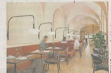
BMW Designers Architects

Innere Stadt. In der Annagasse 7 fügt sich der Mailberger-Hof mit seinen historischen Kreuzgewölben in die Riege der Wiener Stadthotels ein. Einst wohnte der bekannte Malteser-Kardinal Leopold Graf Kollonitsch in dem aus der Barockzeit stammenden Palais im ersten Bezirk. Nach einer wechselvollen Geschichte wird nun die bislang als Hotel genutzte Immobilie im Frühjahr 2025 neu eröffnet, und zwar mit Schiehser Hotels als Betreiber. Nach dem Umbau verfügt der Mailberger-Hof über insgesamt 50 Zimmer, einen Saunabereich sowie eine Champagner-Bar namens „CruX“. Letztere sei nicht nur Hotelgästen vorbehalten, heißt es in der Aussendung von Schiehser, einem 2019 gegründeten Hospitality-Unternehmen. Das Interior-Design stammt von BMW Architektur & Design. Aufenthalt können zu einem Preis ab 300 Euro/Nacht gebucht werden. (red.)