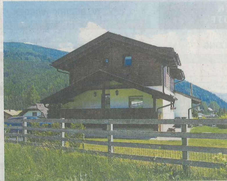
Das neue Chalet in Neukirchen am Großvenediger (links); das verfügbare Objekt in St. Oswald bei Bad Kleinkirchheim (rechts).

die künftigen Besitzer derzeit noch mitbestimmen, ob sie drei Schlafzimmer und zwei Bäder haben möchten oder lieber weniger, aber größere Zimmer. Im Keller gibt es außerdem einen Wellness- und Fitnessbereich mit Sauna und zwei weitere Schlafzimmer; für ein starkes Netz sorgt eine Glasfaser-Ausstattung. Vermittelt wird das Chalet über Engel & Völkers Graz City, der Kaufpreis beträgt 1,45 Mio. Euro inklusive vier überdachter Stellplätze.